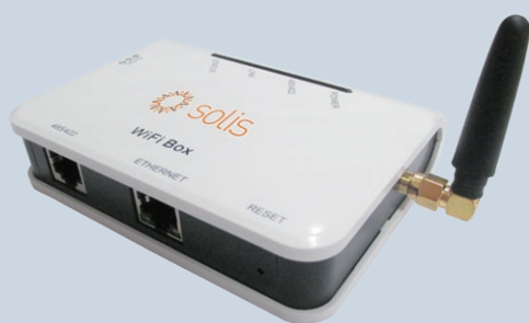
Data Logging Box DLB