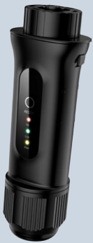
G2-WL-ST (4 Pin)